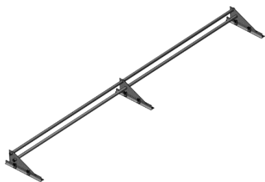
Снегозадержатель Optima 3 метра