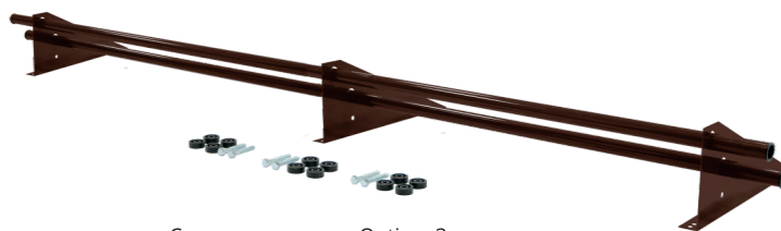
Снегозадержатель Optima 3 м