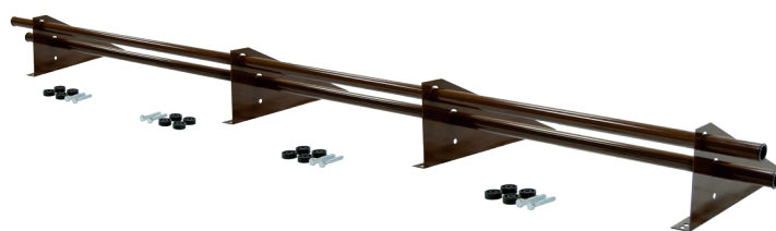
Снегозадержатель Optima Плюс 3 м