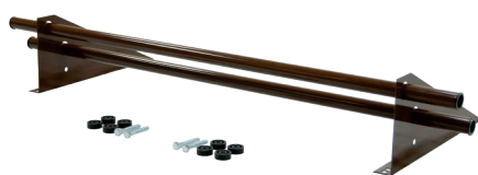
Снегозадержатель Optima 1 м